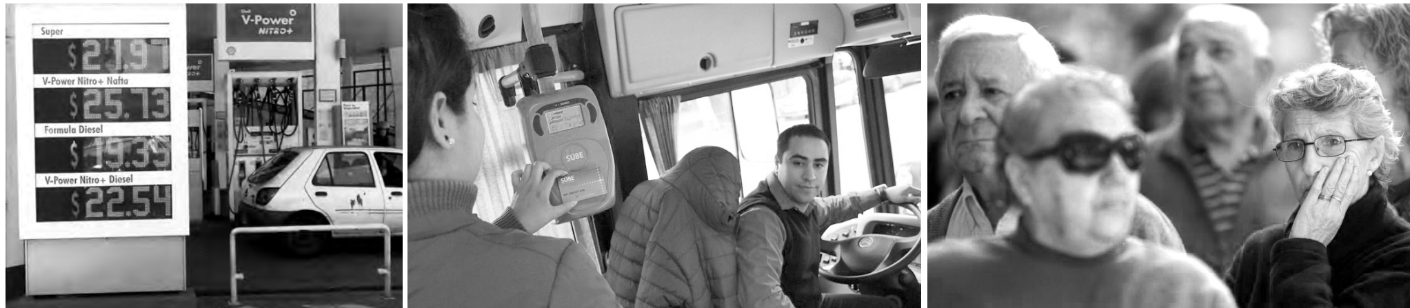
La receta de Macri: aumento en los combustibles, tarifazos, rebaja en las jubilaciones y reforma laboral

Se van conociendo las nuevas medidas económicas del gobierno poselecciones.