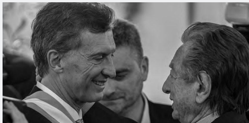
Mauricio Macri y su padre: socios en la corrupción