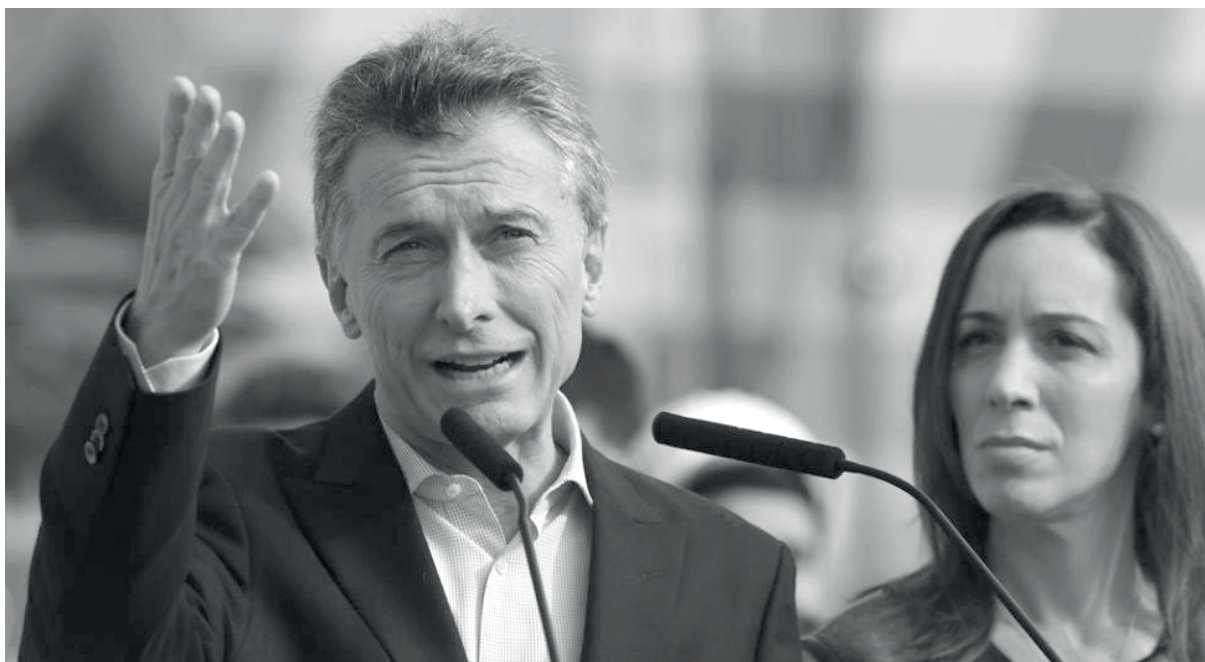
El pueblo y los trabajadores seguiremos en las calles enfrentando la receta de Cambiemos

En primer lugar, es necesario aclarar que hay fracciones del electorado (empresarios, clase media alta y alta) que votan convencidos a Cambiemos en función de sus in-