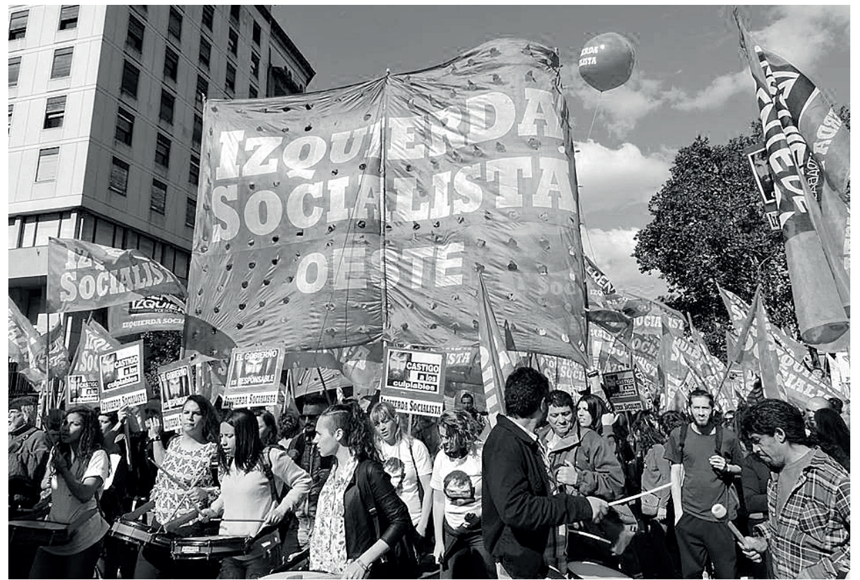
Izquierda Socialista en una de las marchas por Santiago Maldonado

En el sindicalismo combativo somos una palanca para impulsar asambleas y luchar, como con la Bordó Nacional en ferroviarios, nuestra agrupación Docentes en Marcha que realizó un exitoso encuentro nacional en Rosario y otras