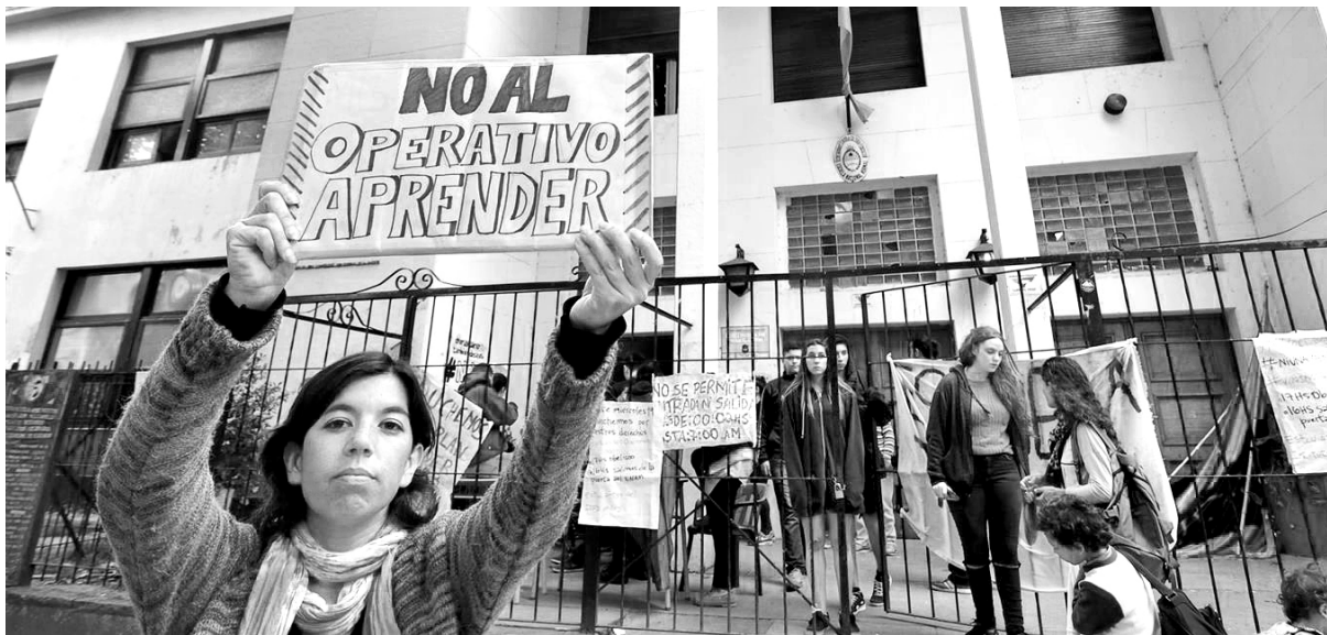
Igual que en 2016 docentes y estudiantes se oponen al operativo Aprender

Para avanzar con cierto consenso social, este gobierno, al igual que los anteriores, se ha ocupado de denunciar el estado de crisis de la