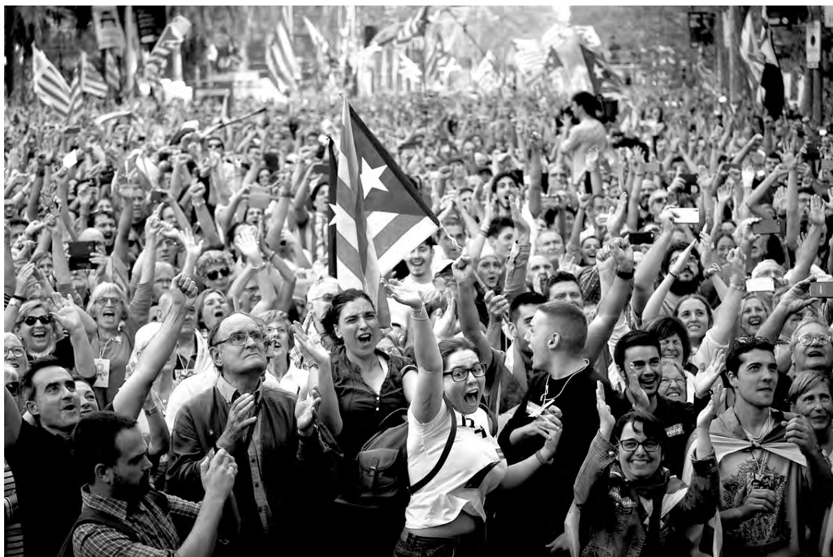
Una de las multitudinarias marchas por la independencia de Catalunya

Sin la Plataforma del sindicalismo y la izquierda combativa en defensa de derechos y libertades